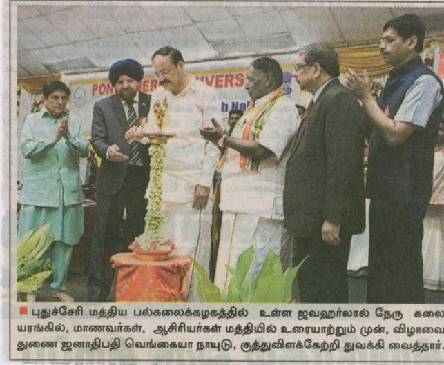
புதுச்சேரி மத்திய பல்கலைக்கழகத்தில் உள்ள ஜவஹர்லால் நேரு கலை யரங்கில், மாணவர்கள், ஆசிரியர்கள் மத்தியில் உரையாற்றும் முன், விழாவை துணை ஜனாதிபதி வெங்கையா நாயுடு, குத்துவிளக்கேற்றி துவக்கி வைத்தார்.