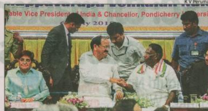
GLAD TO MEET YOU: Vice-President M Venkaiah Naidu being greeted by chief minister V Narayanasamy at a function of Pondicherry University on Friday. Also seen is lieutenant governor Kiran Bedi.

He said there are reports that local languages are vanishing in the country. "It is not a good sign. Mother tongue is like our eyes and other languages are like our spectacles. I want all the institutions in India, including science, technology, and medicine, to teach in mother tongues of students. The students must master their mother tongue and learn as many languages as possible," he said.