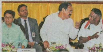
Vice-President Venkaiah Naidu with Chief Minister V. Narayanasamy and Lt. Governor Kiran Bedi at a function at Pondicherry University on Friday.

"We must make our youngsters to respect women, fellow students and