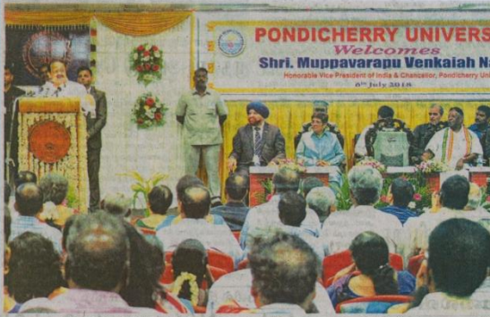
புதுவை பல்கலைக்கழகத்தில் நடந்த கலந்துரையாடலில் துணை ஜனாதிபதி வெங்கையா நாயுடு உரை நிகழ்த்திய காட்சி.