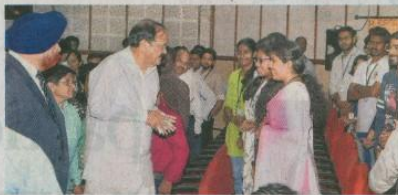
Vice-President Venkaiah Naidu interacting with students at the Pondicherry University.

In the course of his address, the Vice-President also pointed out that parents must teach children in their mother tongue at home. Instead of teaching the children