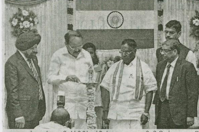
புதுவை பல்கலைக்கழக நிகழ்ச்சியில் பங்கேற்ற துணை ஜனாதிபதி வெங்கையாநாயுடு குத்துவிளக்கு ஏற்றி விழாவை தொடங்கி வைத்தார்.